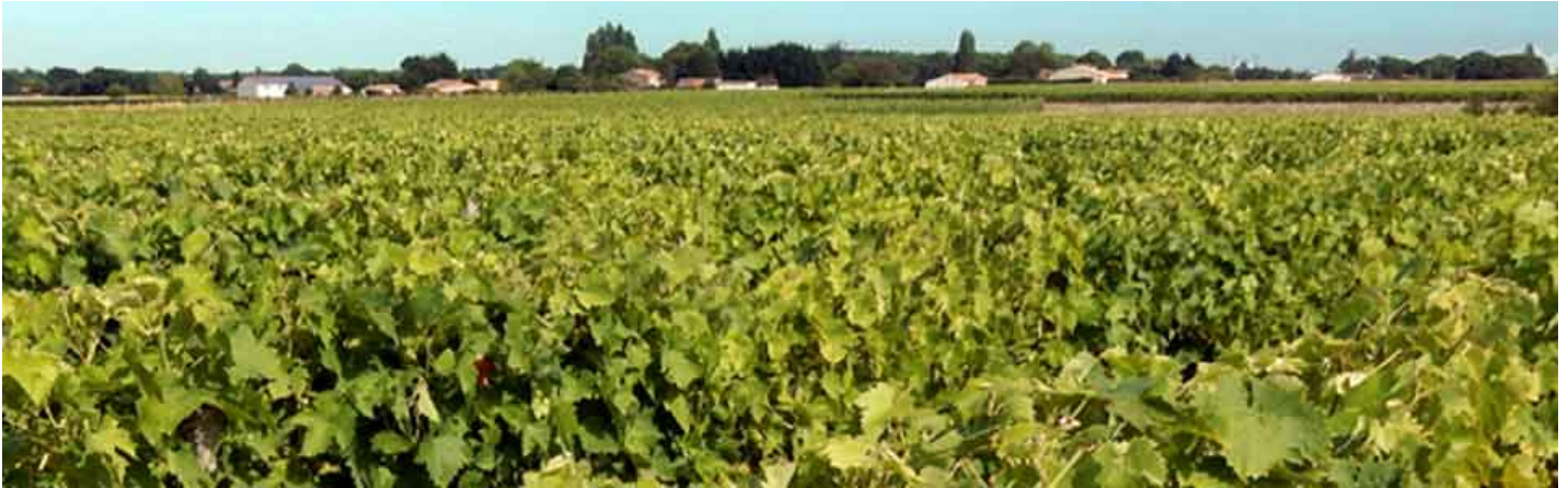
Vignes et villages dans les Charentes

Vous êtes ici: Accueil > Charentes > nos adresses